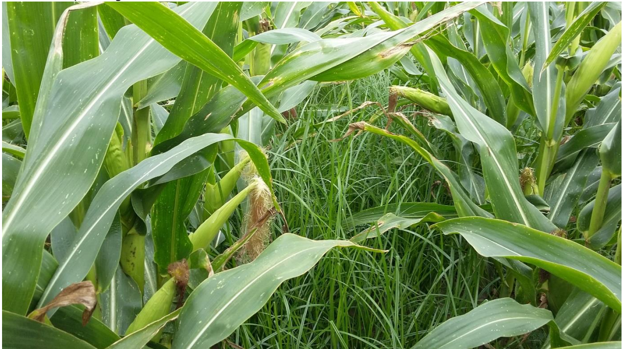
Figuur 2: Knolcyperus niet bestrijden is geen optie!

klein.pdf . Tijdige detectie kan veel verder onheil voorkomen gezien bij een beperkte aanwezigheid nog verdere verspreiding kan vermeden worden.