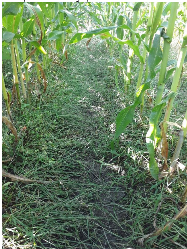
Figuur 1: Indien de gierstgrassen niet vroeg aangepakt worden vormen ze een onkruidtapijt

Na het 2 bladstadium van de maïs wordt de beheersing zo goed als onmogelijk. Indien de voor opkomstbehandeling niet werd uitgevoerd is het belangrijk om zo vroeg mogelijk na opkomst van de maïs te behandelen (uiterlijk 3 bladstadium) met gelijkaardige combinaties maar dan wel aangevuld met een bodemherbicide zoals Frontier Elite 1 L/ha. Vaak zal dit evenwel niet voldoende zijn en lijkt een onderbladbespuiting in het 7/8 bladstadium aangewezen wil men teveel overblijvende gierstgrassen vermijden. Bij een onderbladbehandeling moet men er wel rekening mee houden dat de werking trager verloopt en er ook nog op voldoende kleine onkruiden wordt behandeld.