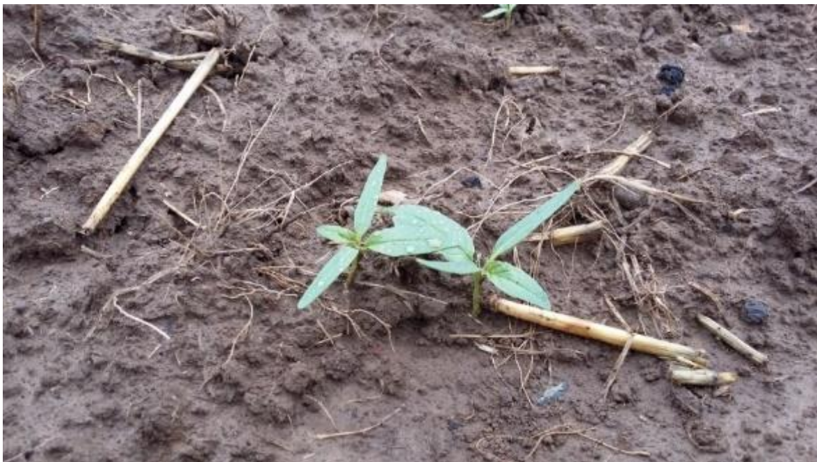
Figuur 3: Doornappel of datura in het kiemlobstadium

De volgende alternatieven leveren voor alle duidelijkheid geen oplossing of bieden allicht onvoldoende garanties: biovergisting, compostering (i.g.v. geen gecontroleerd proces/onvoldoende hoge temperatuur), inundatie, pleksgewijs stomen.